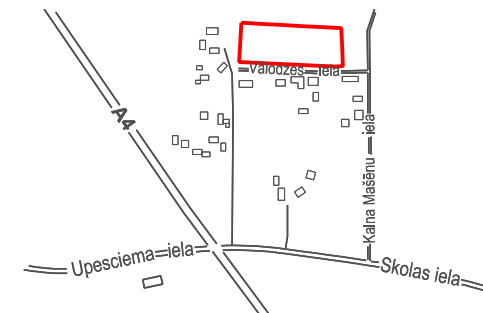
LOKĀLPLĀNOJUMA TERITORIJAS ATRAŠANĀS VIETA