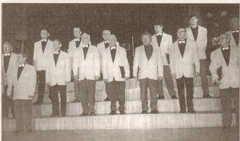
Koris «Vecie draugi».