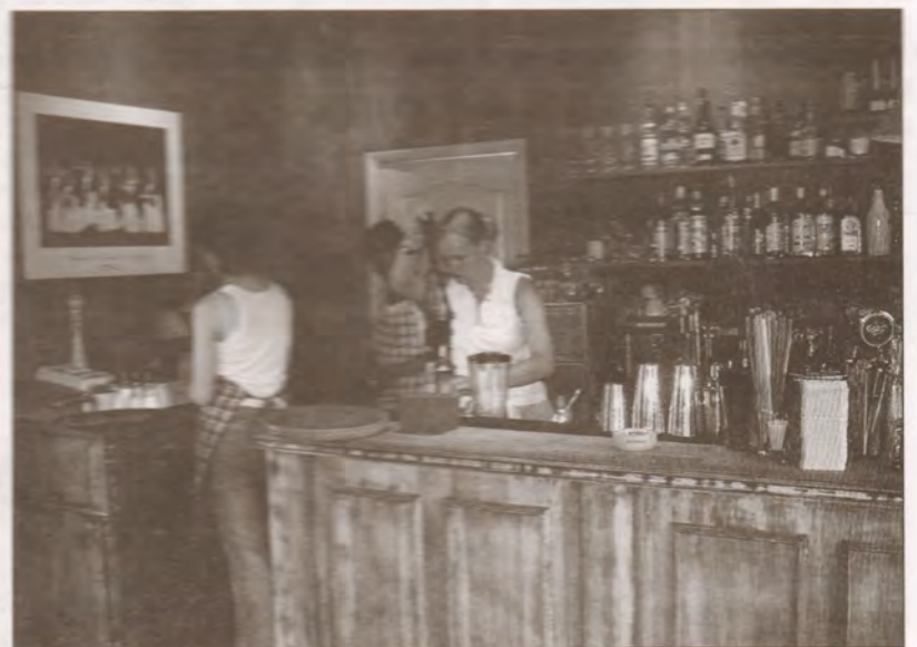
"Bāra dāmas" ir tērptas brīvi - džinsi, krekliņš un impozants ASV krāsu salikuma priekšautiņš, kas pasvīturo krodziņa neformālo atmosfēru.

Nu, ko - lokomotīve ir iestumta, atliek noturēties uz dzelzceļa! Skaties un mācies! Tannis neapšaubāmi ir uzņēmējs, kurš viens no pirmajiem apjautis "VIA BALTICA" autostrādes tuvuma priekšrocību, ko nevar teikt par noplukušajām ceļmalas "ieskrietuvēm" Saulkrastos.