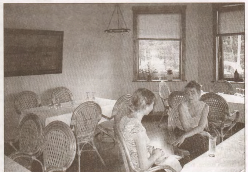
Restorāna zāles galā kādreiz atradies veikals, bet telpas koncepcija izmainīta pilnībā.