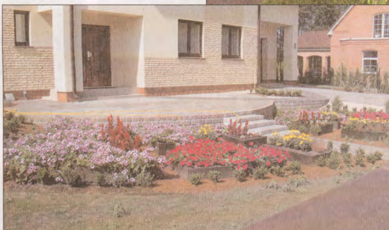
Akmeņu iela 19, Bergos.