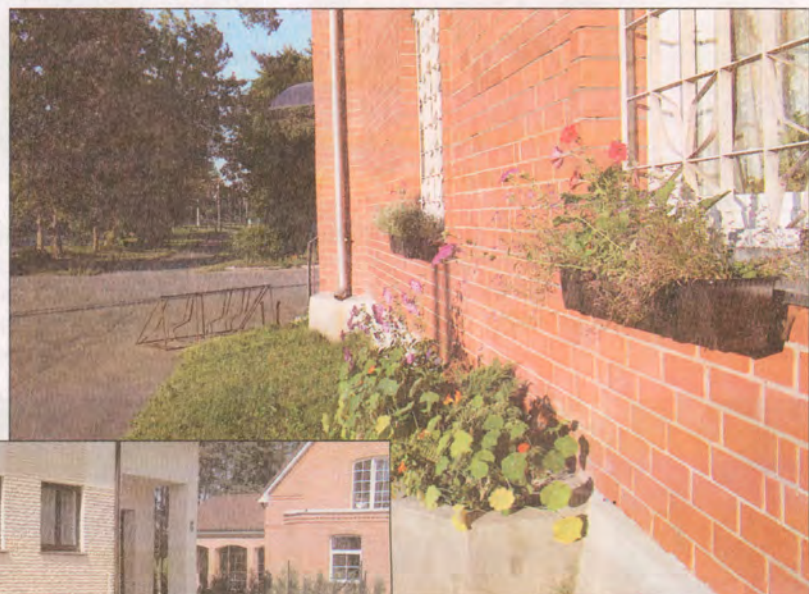
Balva veikals Garkalnē.