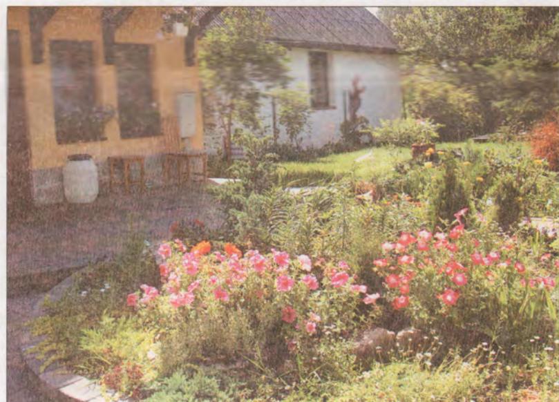
Ziedu iela 1, Upesciemā.