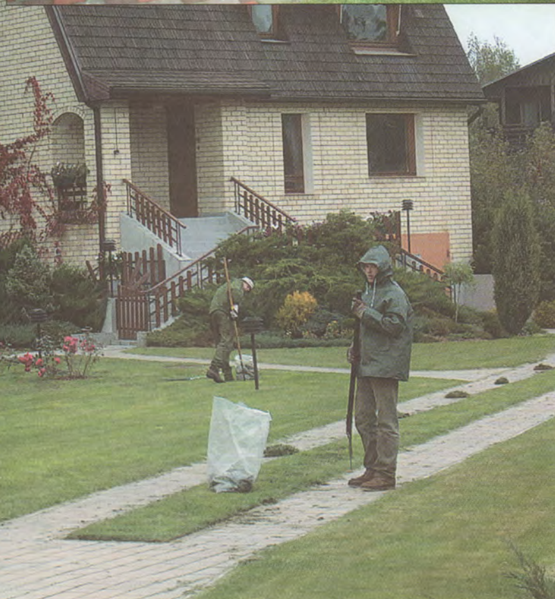
Firmas "Tagete" dārznieki strādā Bukultu "Eglēs".