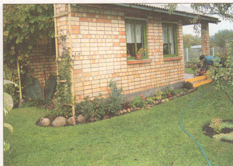
Melleņu iela 22, Krievupē.