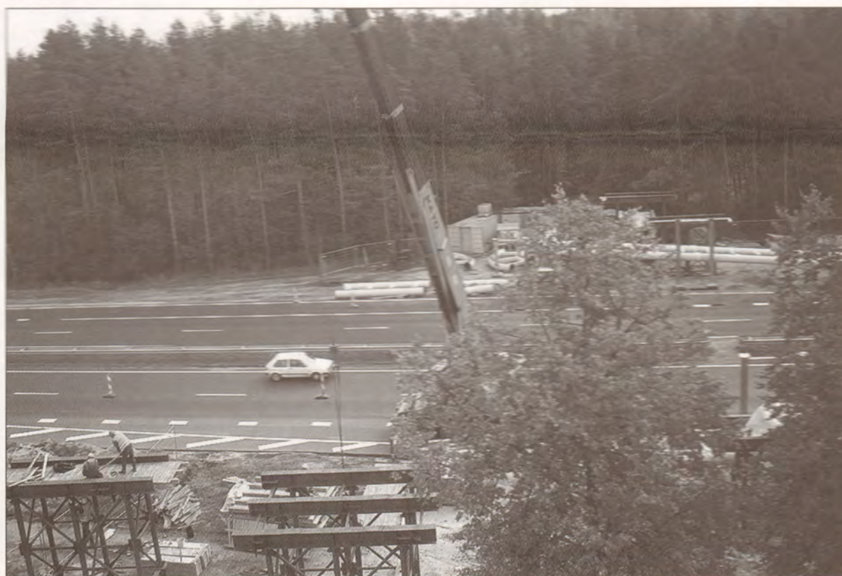
Gaisa pāreja Bergos