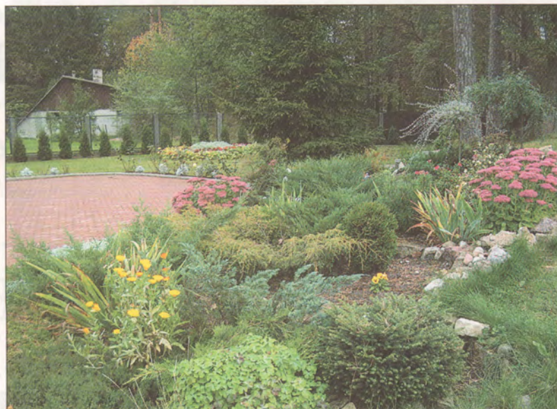
Priežu iela 17a, Garkalnē.