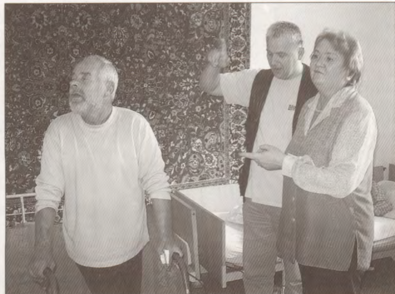
Arvīds izskatījās visai omulīgs un atvērts šim pozitīvajam pārmaiņām