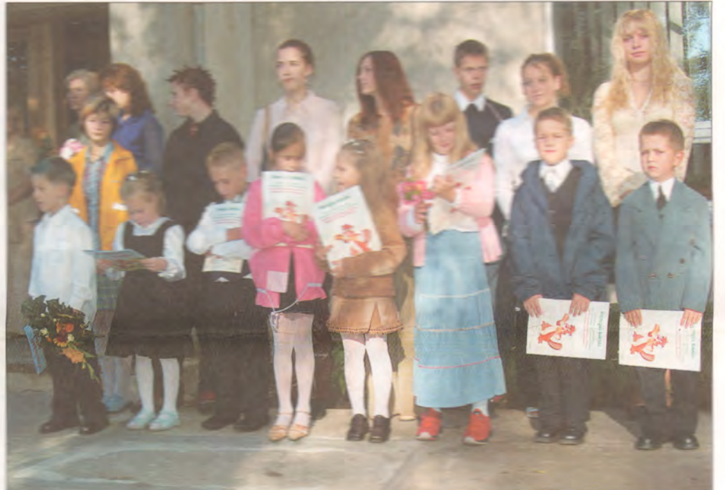
Berģu skolas ābeļnieki jau nonākuši ciešā saskarē ar vecākojām klasēm.