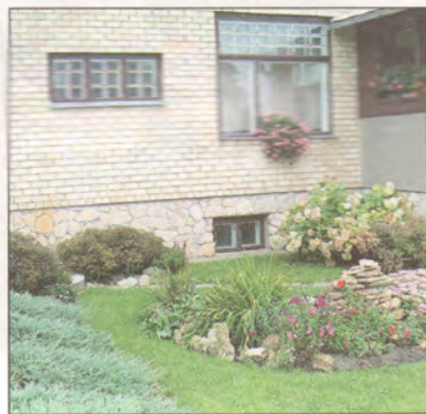
Ata Kokaiņa sēta Bukultos.