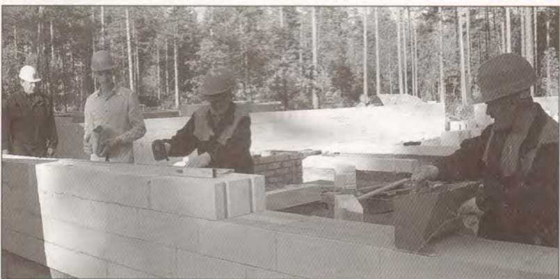
Aeroc bloki ir pateicīgs materiāls.