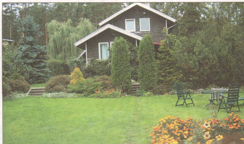
Olgas Rajeckas māja Bukultos.