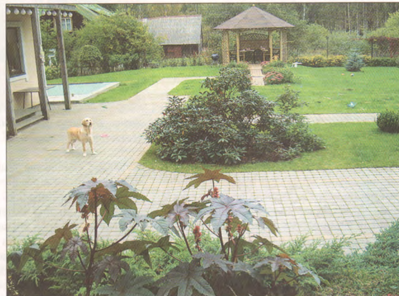
Didža Zariņa māja Bukultos.