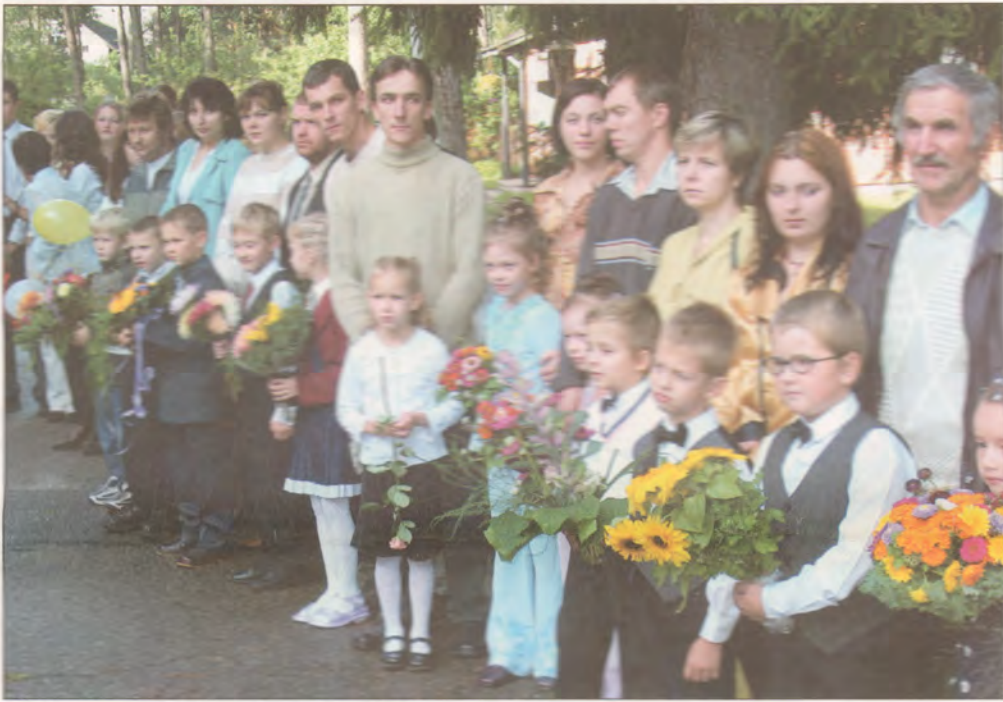
Garkalnes skolas pirmklasnieki vēl savu vecāku pagārnē.