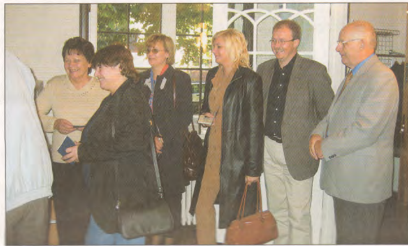
Mūsējie balso Latvijas vēstniecībā Oslo.