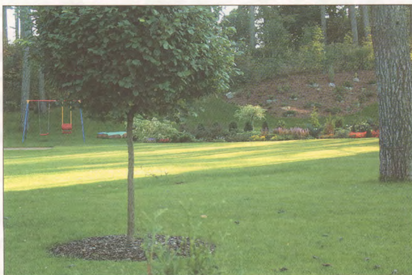
Upesciema 50, Bergos.

Ar šo publikāciju gribam rosināt nošņipkot labas idejas, kas varētu noderēt arī Jūsu sētas labiekārtošanā.