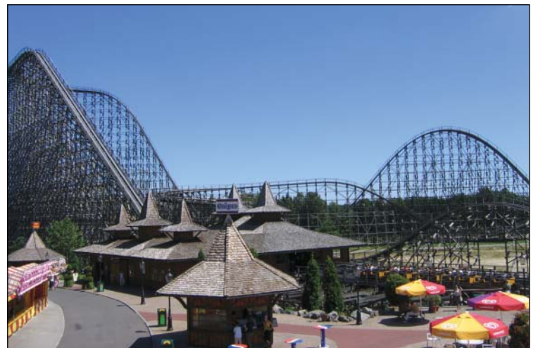
Haidparks ar tā sauktajiem amerikāņu kalniņiem.