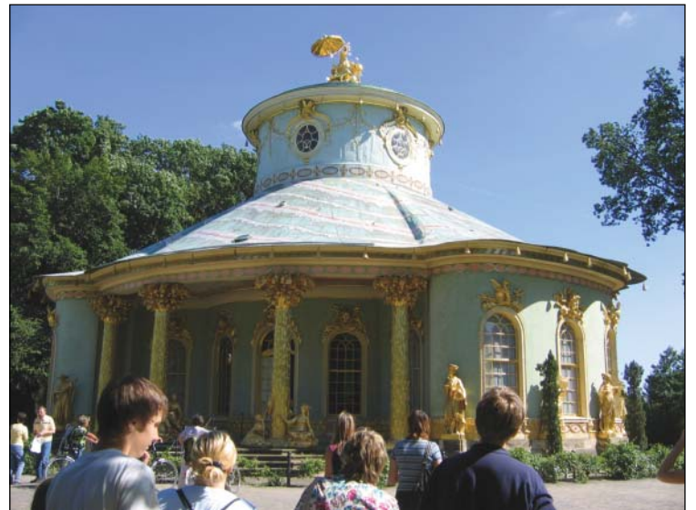
Tējas namiņš – viss zeltā.