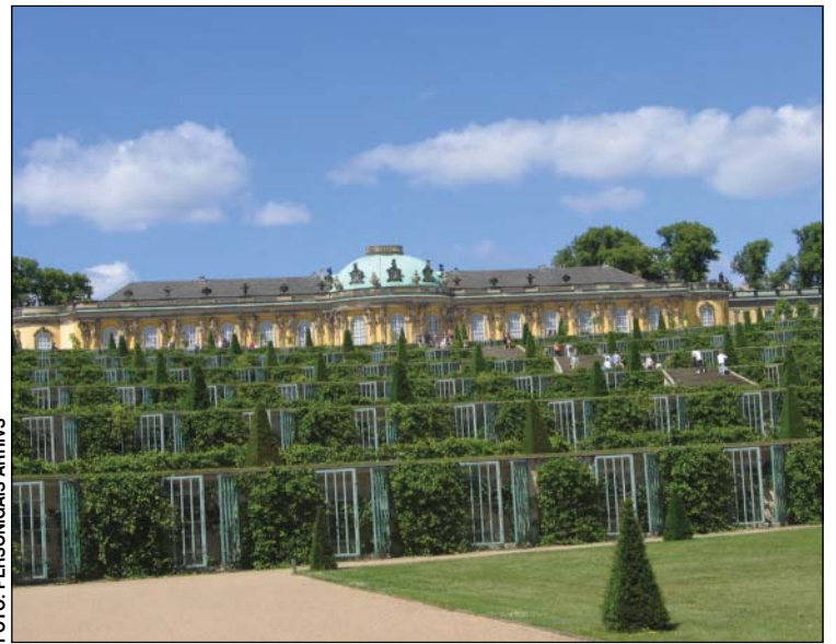
Sansusī pils un viēģes koki.