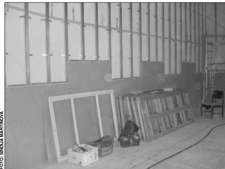
Garkalnes pagasta kultūras nama "Berģi" Mazās zāles remonts tiks pabeigts pēc aptuveni diviem mēnešiem. Šobrīd sienas tiek apšūtas ar rīģipsi.

✓ Augustā tiks pabeigta ceļu izbūve Taku, Griezes un Lauču ielā, kuras pašvaldība pārdeva atklātā izsolē. Graudiņu, Mežvīte-