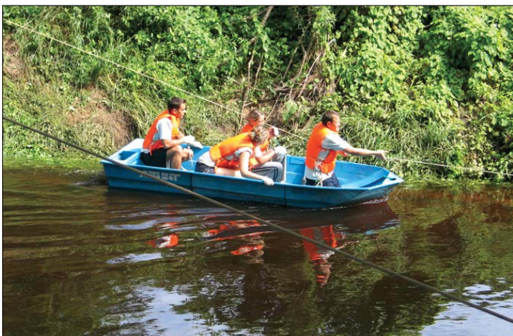
Pēc “pastaigas” pa virvi mūsējiem bija jāpievelkas ar rokām uz otru krastu. Tas esot bijis ļoti smagi.