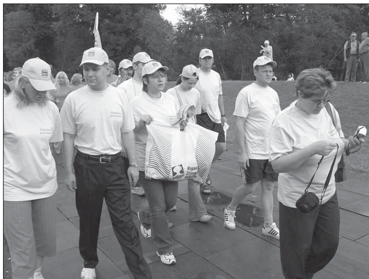
Garkalnes pagasta padomes komanda dodas svinīgajā komandu parādē.