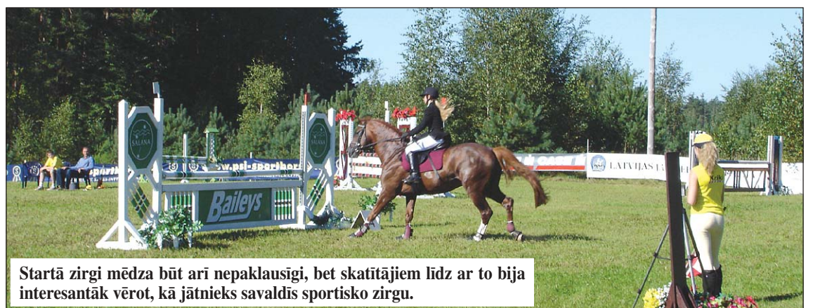
Startā zirgi mēdza būt arī nepaklausīgi, bet skatītājiem līdz ar to bija interesantāk vērot, kā jātnieks savaldīs sportisko zirgu.