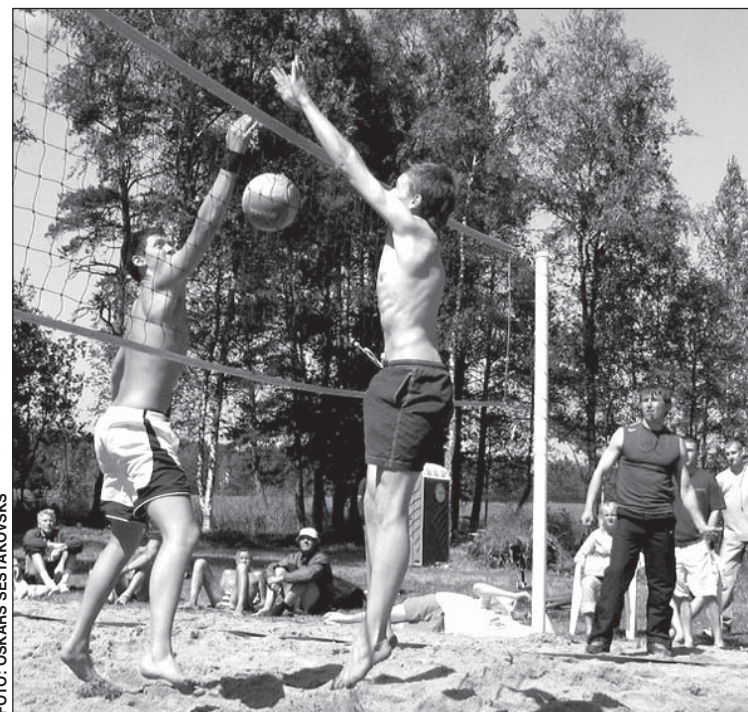
Kadrs no iepriekšējiem pludmales volejbola saspringtajiem mačiem.

28. augustā Langstiņu pludmalē notiks pludmales volejbola sezonas noslēguma sacensības, kurās laipni aicināti piedalīties visi Garkalnes pagastā dzīvojošie volejbola spēlētāji un atbalstītāji. Sacensību organizētāji jau pasūtījuši burvīgu laiku un brīnišķīgus spēles momentus, jums, skatītāji atliek vien piedalīties un priecāties, kā arī atbalstīt savas komandas. Pasākuma dalībnieki "Garkalnes Vēstīm" zināja stāstīt, ka spēles vienmēr tiek aizvadītas jautri un garlaicīgi neesot arī tiem, kuri sāk iepazīties ar pludmales volejbola sportu un tā noteikumiem.