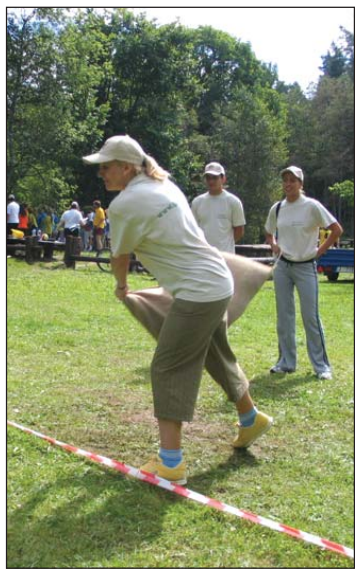
Aelita Veipa met salmu maisu.