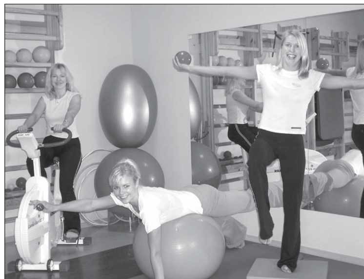
Rehabilitācijas centrs “Baltezers” piedāvā ne tikai Ķīnas tradicionālās ārstniecības metodes, bet arī dažādas citas fiziskās kultūras attīstīšanas iespējas. Viena no tām – vingrošana ar dažādu izmēru bumbām.