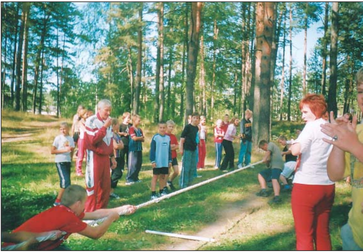
“Spēka vīru” sacensības virves vilkšanā.

Viena no mūsu skolas jaukākajām tradīcijām ir pasākumi, kuros piedalās jauktās skolēnu komandas. Šāda veida pasākumi notiek vismaz divas reizes gadā. Šogad tā bija Sporta diena, kas notika 9. septembrī.