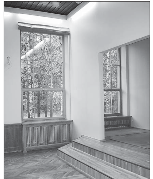
Garkalnes pagasta kultūras nama “Berģi” mazajā zālē plašāku gaismas vilni ļaus iepludināt skaistie koka logi.