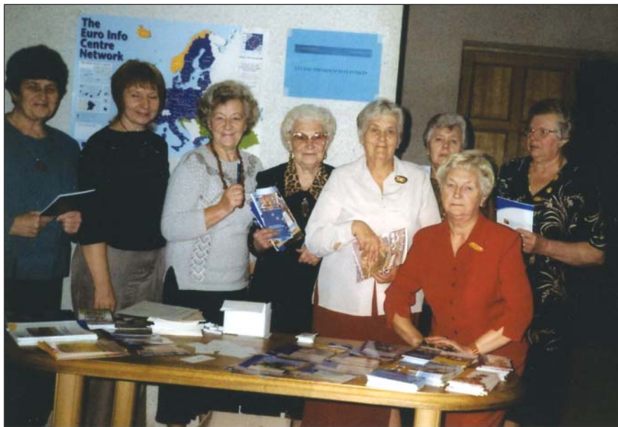
“Strauts” dalībnieki kopā ar Līvānu biedrības “Baltā māja” aktivistēm iesaistās politiskajos procesos, iegūstot informāciju par Eiropas Savienību.

Roku darbu aktivitātes Garkalnes pagasta kultūras nama mazajā zālītē.