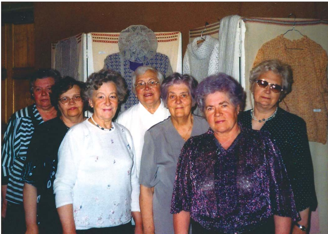
Garkalnes pagasta dāmu klubiņa "Pilādzītis" pārstāves priecējās par rokdarbu izstādi, kuru veidojušas rokdarbu pulciņa dalībnieces.