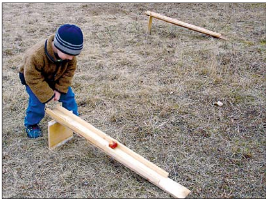
Mazais Silvis ripina olas, apjūsmodams to rotājīgo virpuļošanu.

Brīžam saulainas, brīžam pelēkiem mākoņiem klātas Lieldienas ir pavadītas. Pagājušas vairākas brīvas dienas, kuru laikā varēja atpūsties tradicionālā un kristīgā gaisotnē. Garkalnes novadā kopā pulcējās liels un mazs – Lieldienas tika sagaidītas kristīgi jautrā gaisotnē.