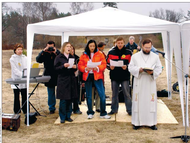
Bergu draudzes koris izpilda svētku dziesmu.