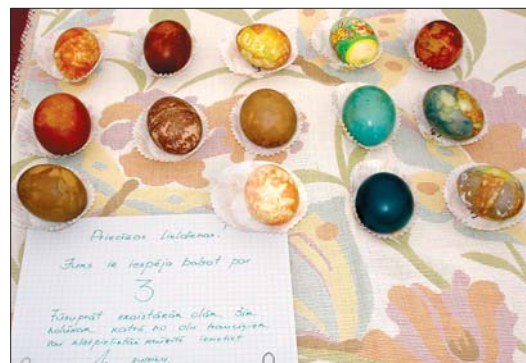
Šīs ir tikai dažas no olām, kuras piedalījās skaistākās un interesantākās olas krāsojuma konkursā, par kurām klātesošie varēja balsot ar pupiņām.