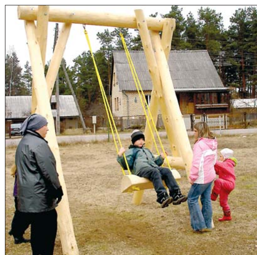
Lieldienu šūpoles turpmāk atradīsies pie Bergu pamatskolas.

piedalīties arī citās atrakcijās. Cilvēki varēja lielīties ar savām krāsotajām olām, piedalīties konkursā, kurā par skaistākajām olām klātesošie varēja balsot ar pupiņām. Sanākušie varēja vērot arī Garkalnes pamatskolas dramatiskā pulciņa uzvedumu. GMM