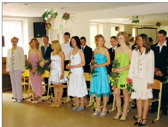
Laimīgjie 9. klašu absolventi...