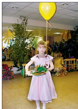
Pie baloniem topošie skolēni sēja savus zīmējumus ar nedarbiem, kurus laida gaisā, lai tie izzustu kā nebijuši.

Pēc svinīgā pasākuma bērni kopā ar vecākiem pie baloniem sēja savus zīmējumus, kuros bija attēloti nedarbi, un laida tos gaisā – lai pirms skolas tie izzūd kā nebijuši. GMV