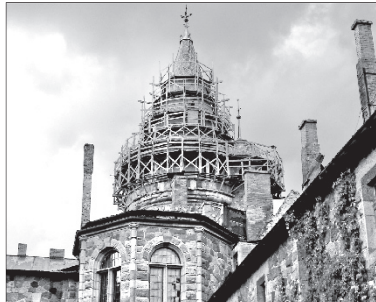
Vidzemes ekskursijas laikā aplūkojam vienu no skaistākajām Latvijas pilīm – Cēsaines pili, kas lēnām tiek restaurēta pēc 2002. gadā notikušās ugunsnelaimes.