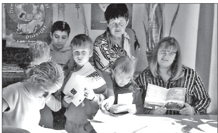
Zināšanas par Eiropas Savienību tiek nodotas rehabilitācijas centra "Baltezers" bērniem.