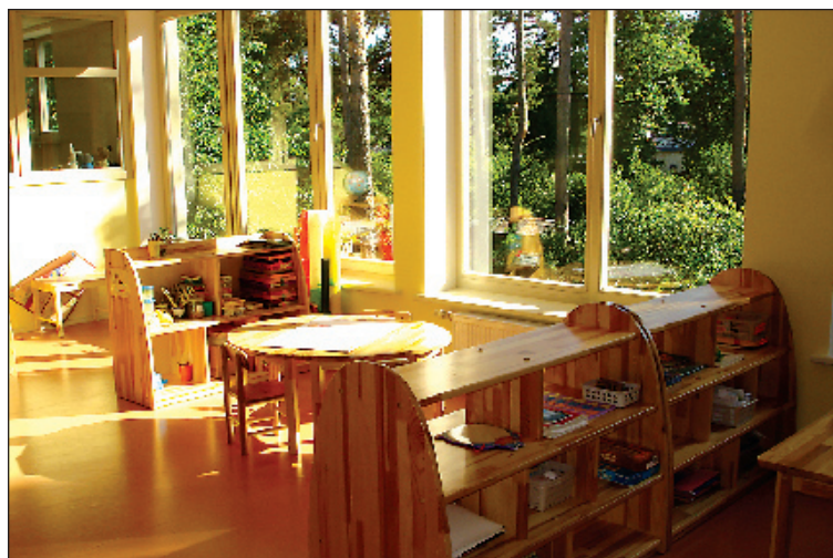
Šādi izskatās viena grupiņa, kura ieguvusi mēbeles, pārējais dārziņš vēl jāapmēbeļē.