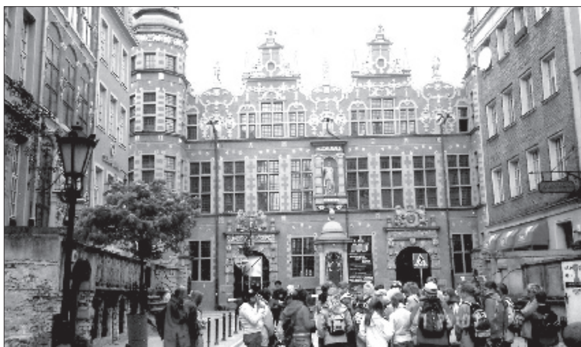
Atjaunotā Polijas pilsēta Gdaņska.