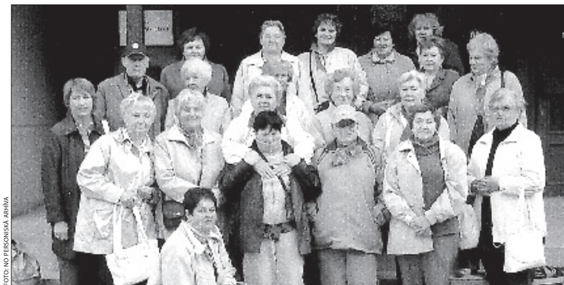
Aktivistu grupa pirms došanās skaistajā ceļojumā.