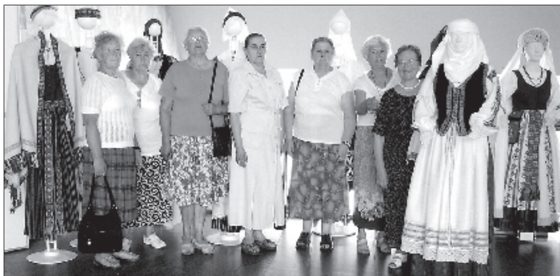
Interesu kluba "Strauts" rokdarbnieces apmeklēja izstādi "Baltica 2006" Kongresu namā. Noskatīti jauni raksti un idejas.