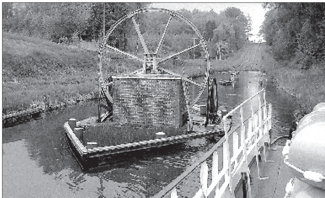
Pasakains skats no plosa uz Mazūrijas ezeru Polijā.