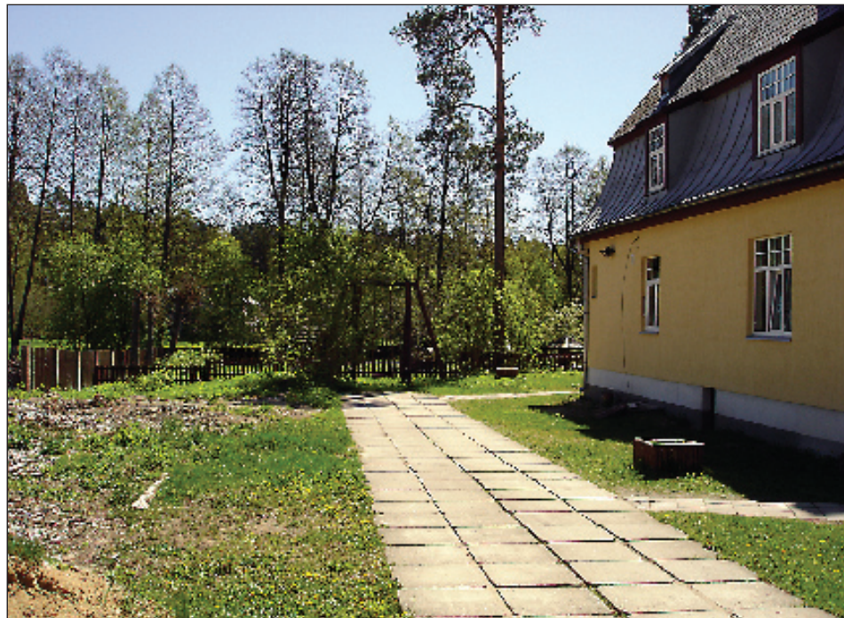
Bērnudārza kreisā puse pirms gada izskatījās pavisam citādāk.