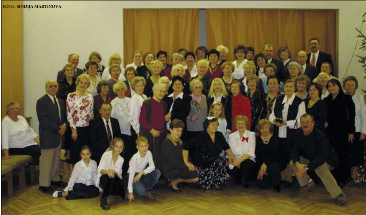
Klātesošie, kā ierasts, veidoja gada foto.

Gada nogale ir brīdis, kad sanākam kopā, atceramies, kas padarīts gada laikā, un spriežam, ko darīsim nākamgad. 16. decembrī kultūras namā "Berģi" pulcējās pensionāru padomes aktīvistu, dāmu klubiņš "Pīlādžītis", rokdarbnieces, kā arī interešu klubs un ansamblis "Strauts".