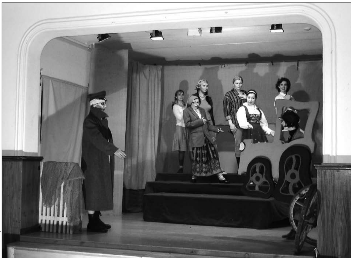
Kadrs no izrādes "Upesciema pavasaris".