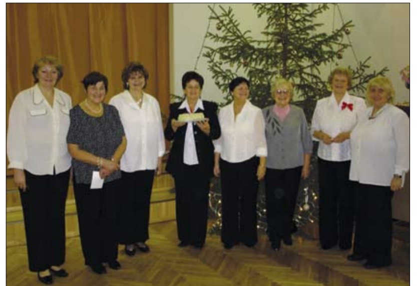
Ansamblis "Strauts" saņem savu pirmo dzimšanas dienas torti ar vienu svecīti.

Gribas, lai baltā pasaulē Balti sniegi snieg, Un uz baltiem lielceļiem Balti cilvēki iet. Un lai baltos cilvēkos Baltas domas dzimst, Un lai baltās darbdiēnās Balti svētki ir. (I. Ziedonis.)