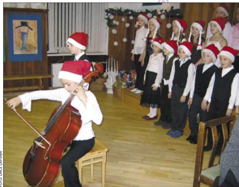
Bērni muzicē par prieku senioriem.