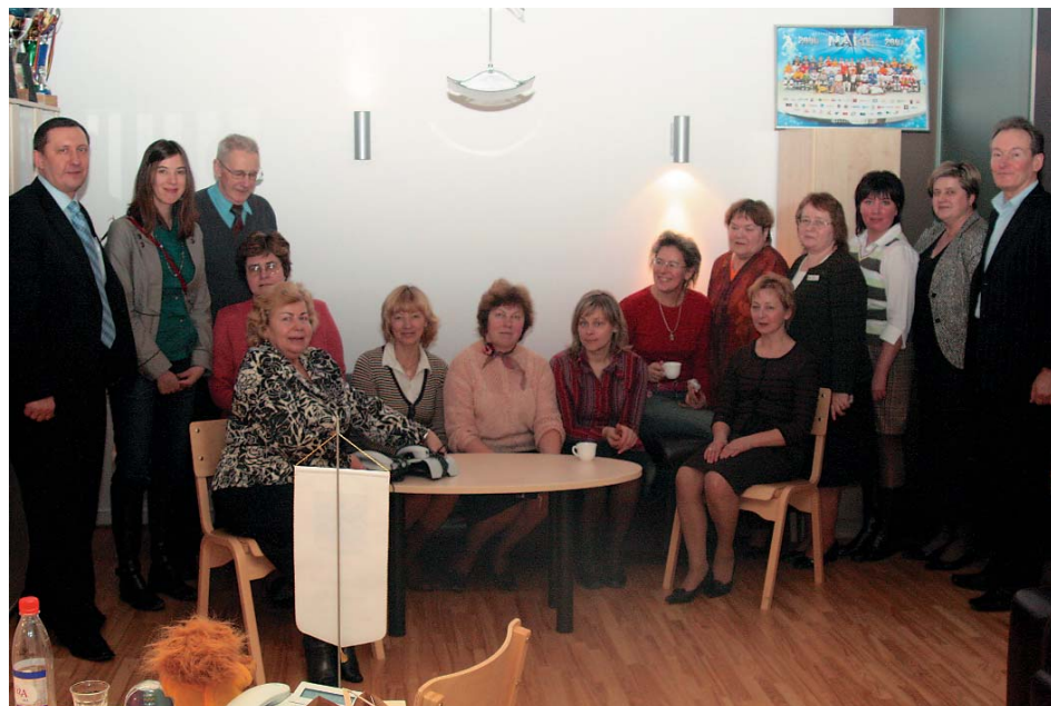
Garkalnes novada Domes darbinieki