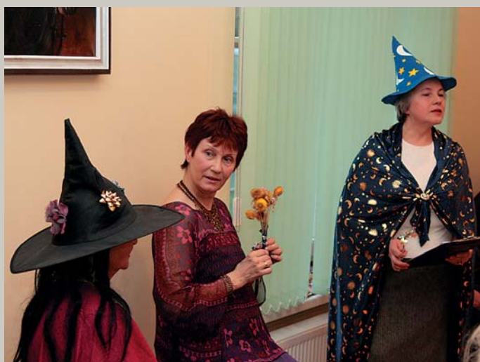
Sēd' uz krēsla, meitu māte, / Lai es varu aptecēt. Cits teic, tev pierē ragi, / Cits teic, ļipa pakaļā. – Pilādžiša zīlēšanas salona pirmā kliente