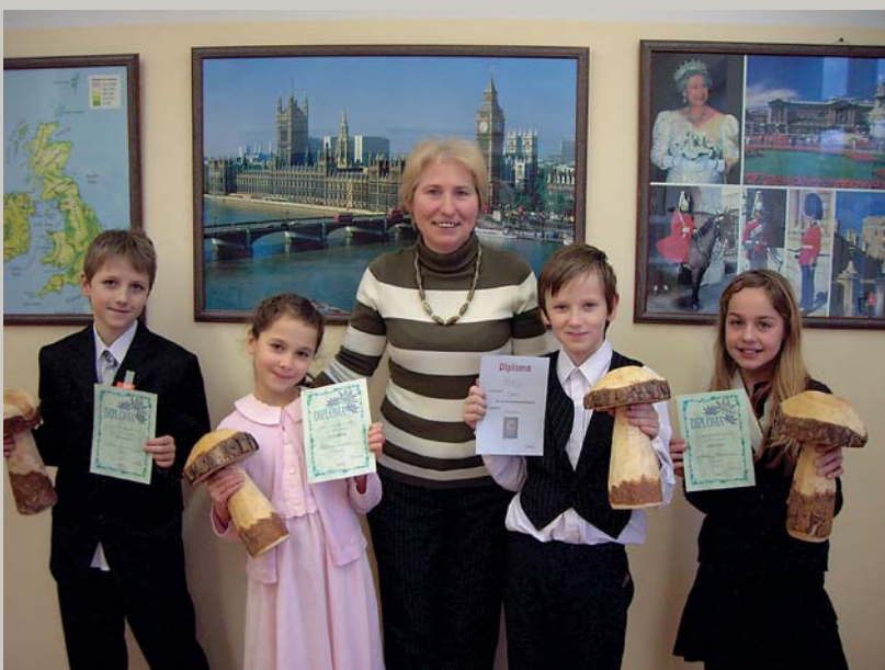
Paldies saku māmiņai, Tā man' labi pamieļoja: Tā man deva sēņu zupi Ar sudraba karotīti. – Berģu skolas angļu valodas čempioni (sk. rakstu 6. lpp.)