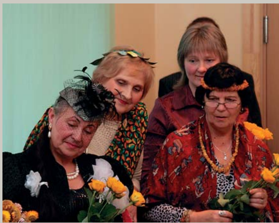
Četras bija brūtes māsas, Divi lielas, divi mazas; Tās lielās tās mazās Ar pupiemi nobadīja. – Fejas un burves vēlē laimi