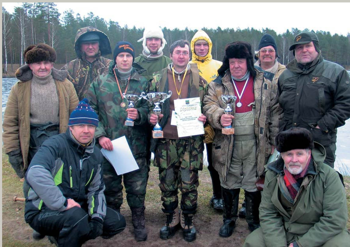
Dod, māmiņa, kam dodama, / Nedod mani zvejniekam: Zvejniecīga dvēselīte / Virs ūdeņa lidināja. – Garkalnes novada labākie zemledus makšķernieki (sk. rakstu 6. lpp.)