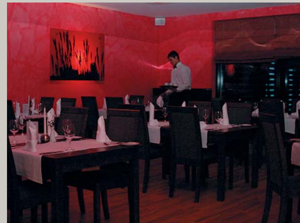
Uz krodziņu ceļu zinu, / Uz baznīcu nezināju; Uz krodziņu klajs celiņš, / Uz baznīcu žagarains. – Restorāns Sunset viesnīcā Baltoilla (sk. rakstu 3. lpp.)