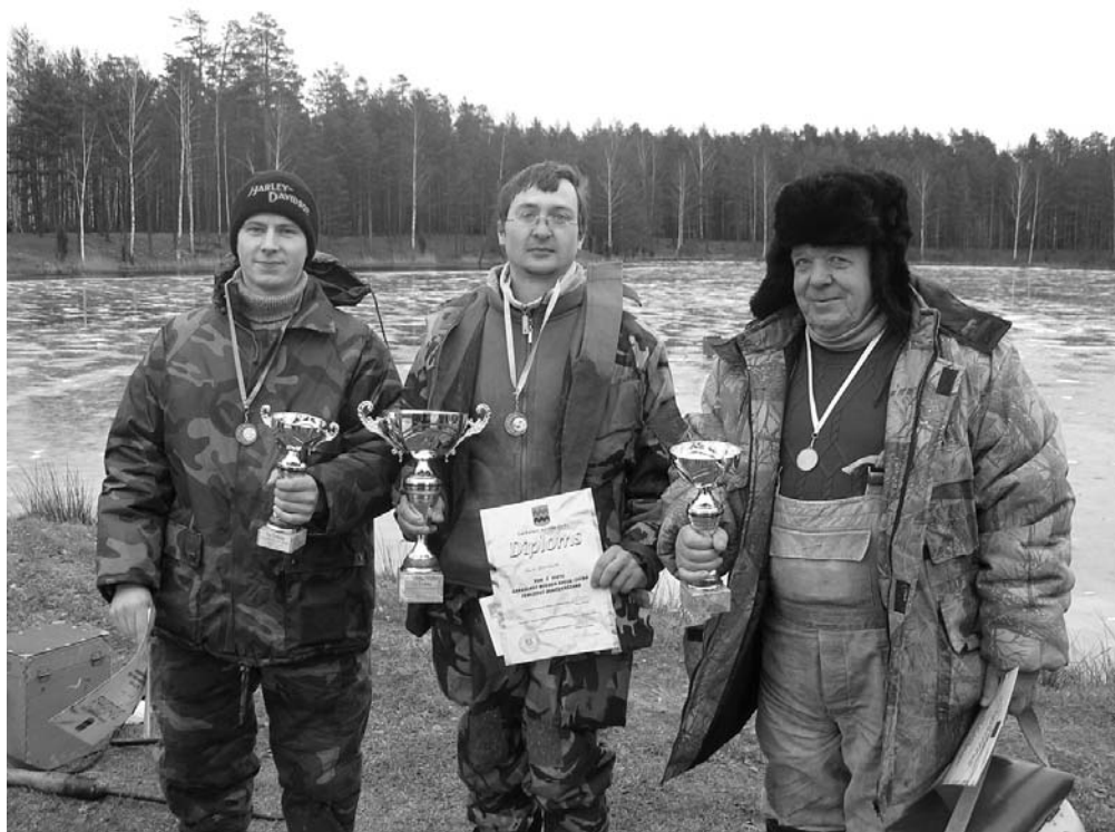
Veiksmīgākais makšķerētāju trijnieks