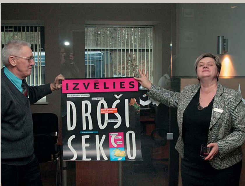
Ozols auga ar liepiņu / Vienā lazdu krūmiņā; Es uzaugu ar tautieti / Vienā kunga novadā. – Garkalnes novada Domes jauno telpu atklāšana