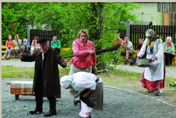
Veca bāba zilim zobim / Savu meitu dāvoināja. Es neņemšu tavu meitu, / Tava meita piegulēta. Pilādžiša Jāņu mistērija Īsa pamācība milēšanā