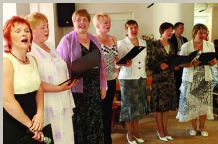
Zied ābele pret ābeli / Katra kalna galiņā; Dzied māšiņa pret māšiņu / Katra kunga novadā. Izlaidums Garkalnes skolā