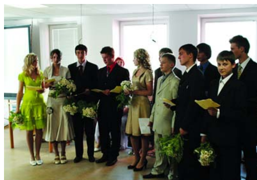
Garkalnes skolas 9. a klase