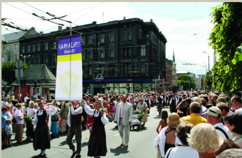
Ejam, brāļi, mēs uz Rīgu, / Rīgā laba dzīvošana; / Stikla durvis, vara vārti Verās paši neverami. (Garkalnes Dziesmubērni gājienā)