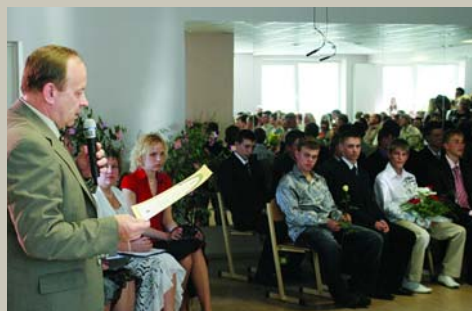
Es jums saku, jauni puīši, / Nesien zirgu pie vītola; Sien pie zaļa ozoliņa, / Lai rīb zeme dancojot. Izlaidums Garkalnes skolā