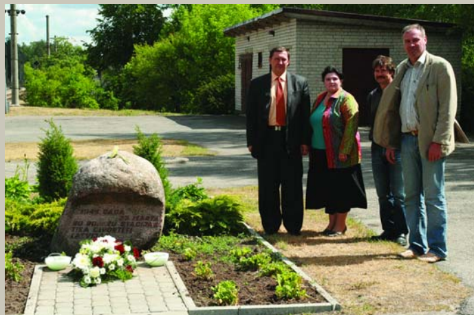
Ai, caunīte, vāverīte, / Dod man savu kažociņu, Tu gulēji siliņā, / Es Keizara leģerī.