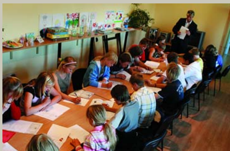
Nemācēju bāliņās / Enģu durou virināt, Kā mācēju tautiņās / Iecejamas, izcejamas. Garkalnes bērni kāro velosipēdista eksāmenu CSDD uzraudzībā