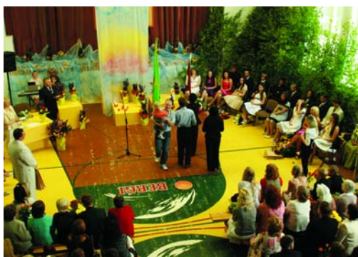
Berģu skolas izlaidums

Vairāk Berģu un Garkalnes skolu 2008. gada izlaidumu bildes skatiet www.garkalne.lv