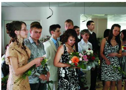
Garkalnes skolas 9. b klase