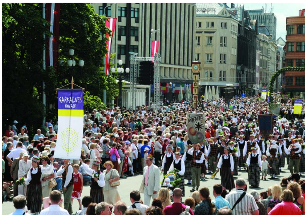
Garkalnes novads Dziesmu un deju svētku gājienā pie Brīvības pieminekļa

Katra tautas dziesma mums ikvienam ir tikai tik vērtā, cik mēs tai atrodam izvedumu, izvedumu katrā paša šajā, šibriža dzīvē. To var saukt arī par pielietojumu. Kad mēs Jāņu dziesmas dziedam tikai tāpēc, ka kaut kas jau ir jādzied, neērti tā klusēt, kad visi dzied, tad tas ir tikai tāds plikais pielietojums. Bet dziesma apaug ar mani pašu, ar visu manu jušanu, kad es saredzu tos tālumus, no kurienes tauta to iznesusi. Pat tad kad Kauniņš bija Jānišam, Mazi nāca Jāņa bērni, Cits penteris, cits tenteris, Cits likām kājiņām . Pat tad tā ir stipra tautas dziesma, jo cauri gadsimtiem grūtdieņu nasta, un tas ar tām kājēļiem nepavisam nav vainīgs, ka tās viņam likas, – mazāk par četrpadsmit stundām jau nu klaūšu zemnieks nestrādāja un tad vēl atrada laiku sievu apmījot, bērnus izaudzināt un dziesmu kopt, dziesmu kopt – noteikti, nešaubīgi, dziedāt – būtiski, pastāvēšanu apliecinot, cilvēcību uzturot, garīgumu nosargājot. Un tad tas nekas, ka cits penteris, cits tenteris, cits likām kājiņām . Taisni otrādi – tas ir vareni, ka mēs varam par savu nelaimi pasmieties un laimes likumu dziesmā uzturēt.