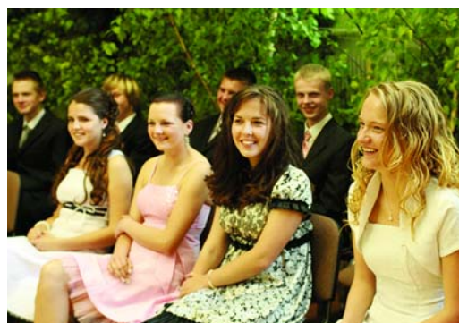
Berģu skolas meitenes