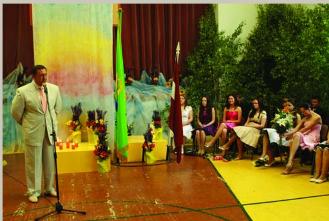
Teicat, meitas, man dziesmiņu Jēle kādu nezināmu, Ai es jums pasacišu Nezināmu tēva dēlu. Izlaidums Berģu skolā

Dažādu novada pasākumu bilžu galerijas varat skatīt www.garkalne.lv foto galerijas