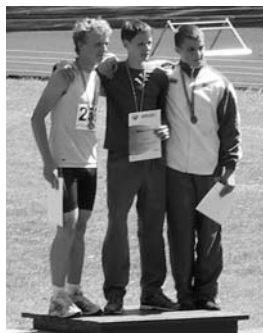
Deivids pirmais no labās