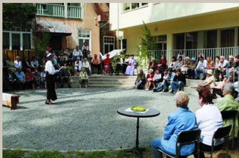
Iet iekšā, vaj neiet, Tāi groznā ciemiņā? Rīņķiem griezts pagalmiņš, Dēļiem jumta istabiņa. Pilādžiša Jāņu mistērija Īsa pamācība milēšanā