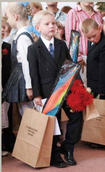
Ganiņš gana ceļmalā, / Dievpalīgu gaidūdams. / Dievs palīdz tev, ganiņ! Paldies, ceļa gājējiņ! 1. septembris – Garkalnes skolas pirmklasnieks