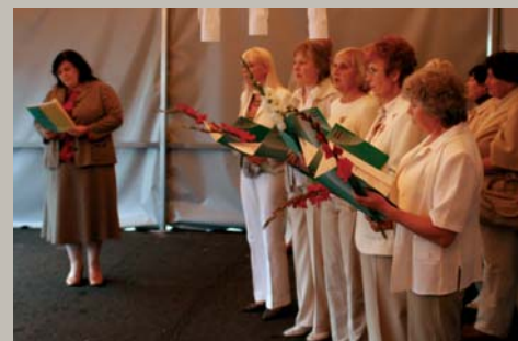
Tricēj' kalni, skanēj' meži, / Kad dziedāja lejiņā; Saka ļaudis dzirdēdami: / Lakstīgalas skaisti dzied. Projekts – Gaismas tilti. Dāmu klubs Pilādītis skaisti dzied