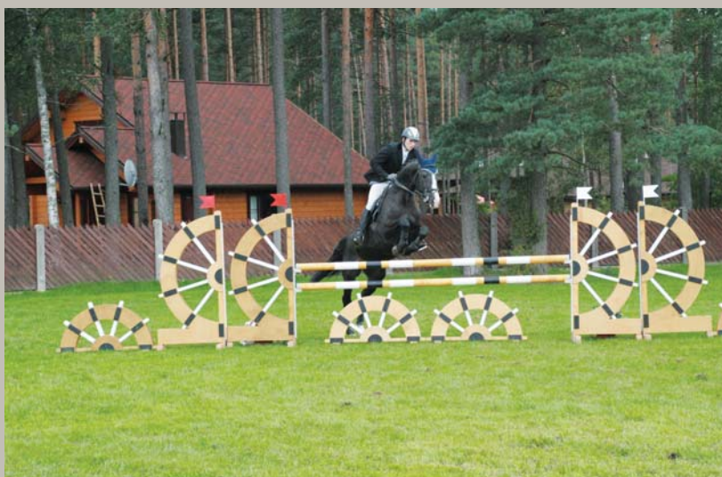
Pamazam es dzīvoju, / Pamazam Dievs palīdz; / Pamazam es groziju / Lielas naudas kumeliņ'. Atklātais čempionāts jātnieku sportā – Uzoarētāju apbalvošana