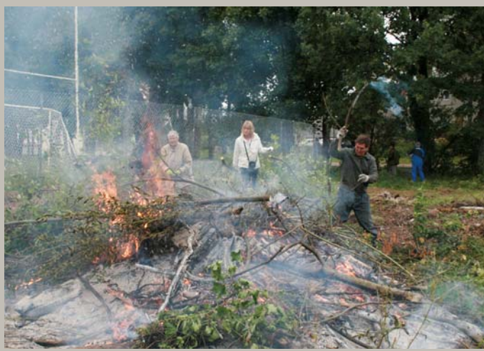
Slauk', māmiņa, istabiņu, / Met mēsliņus ugunī: Aiz Daugavas suņi rej, / Jāj no Rīgas precinieki. Lielā talka Upesciemā