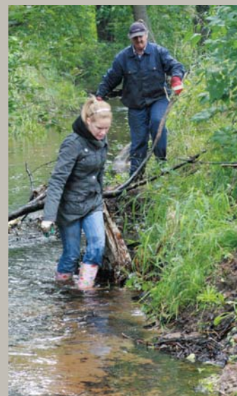
Upe, upe, meita, meita, / Abas vienu daiļumiņu: / Tēk upīte riņķodama, Iet meitiņa dziedādama. Lielā talka Garkalnē – Krieupes tīrīšana

"Garkalnes novada vēstis", Nr. 74 Brīvības gatve 455, Rīga, LV-1024