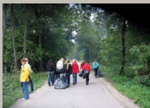
Jauni puīši, jaunas meitas Tirijiet ceļa malas: Dieviņš jāja, Laime brauca, Pakrīt Laimes kumeliņš. Lielā talka Garkalnē