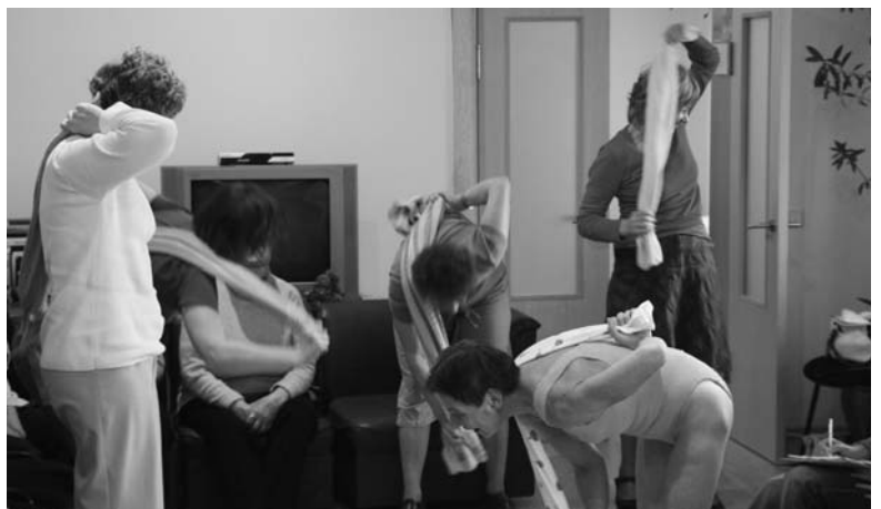
Zingīte stāsta, kas jā dara, lai būtu vesels