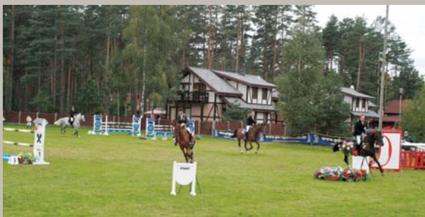
Jāju, jāju kunga zirgu, / Kad tas kritīs, kungs dos citu, Lielu bērnu strupu asti. Atklātais čempionāts jātnieku sportā – uzoarētāji jāj goda apli