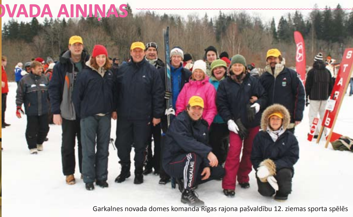
Garkalnes novada domes komanda Rīgas rajona pašvaldību 12. ziemas sporta spēlēs