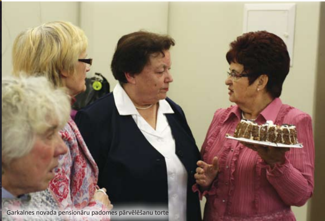
Garkalnes novada pensionāru padomes pārvēlēšanu torte