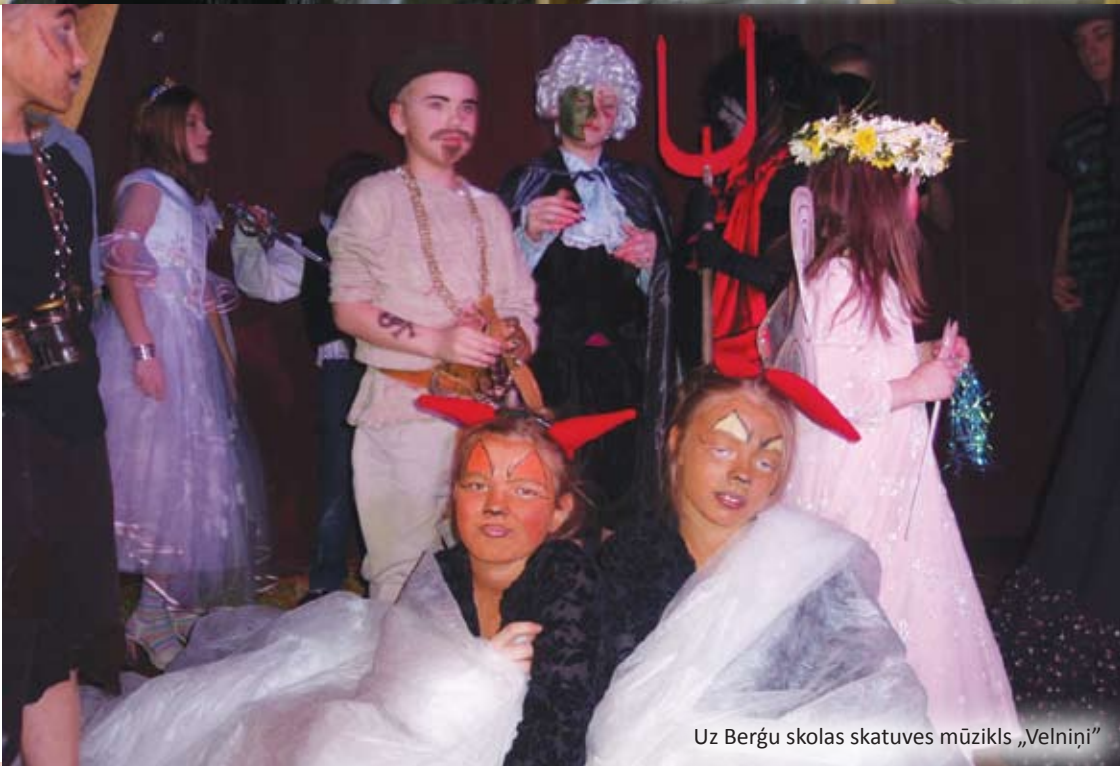
Uz Berģu skolas skatuves mūzikls „Velniņi”