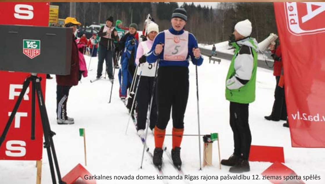
Garkalnes novada domes komanda Rīgas rajona pašvaldību 12. ziemas sporta spēlēs