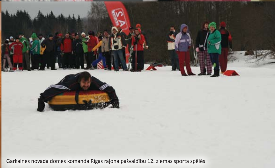
Garkalnes novada domes komanda Rīgas rajona pašvaldību 12. ziemas sporta spēlēs