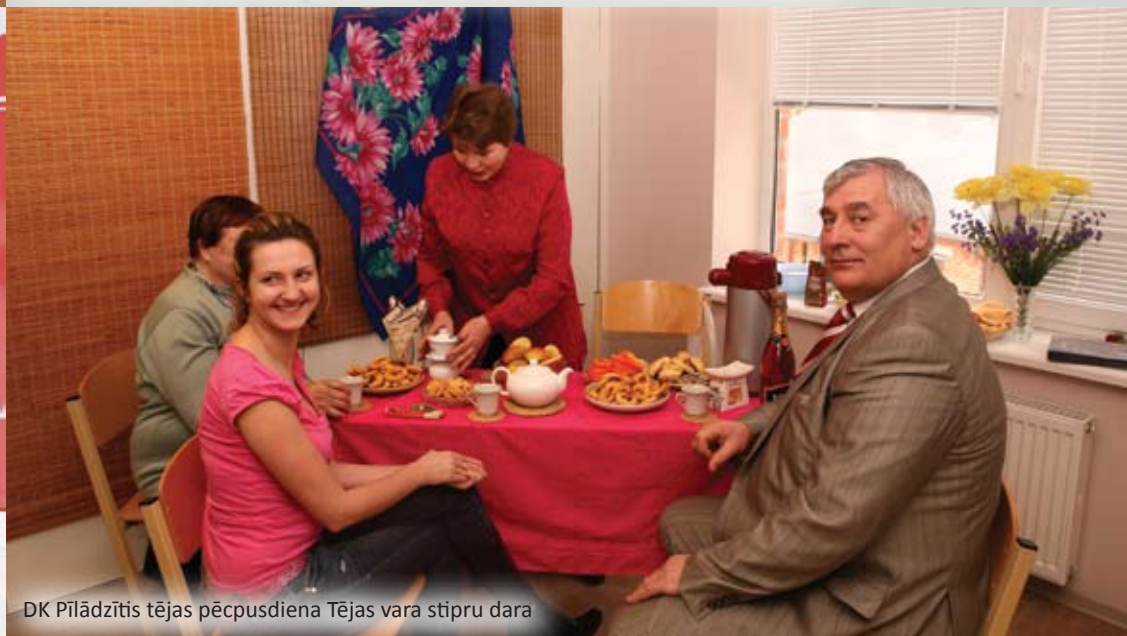
DK Pīlādzītis tējas pēcpusdiena Tējas vara stipru dara