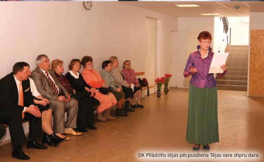
DK Pīlādzītis tējas pēcpusdiena Tējas vara stipru dara