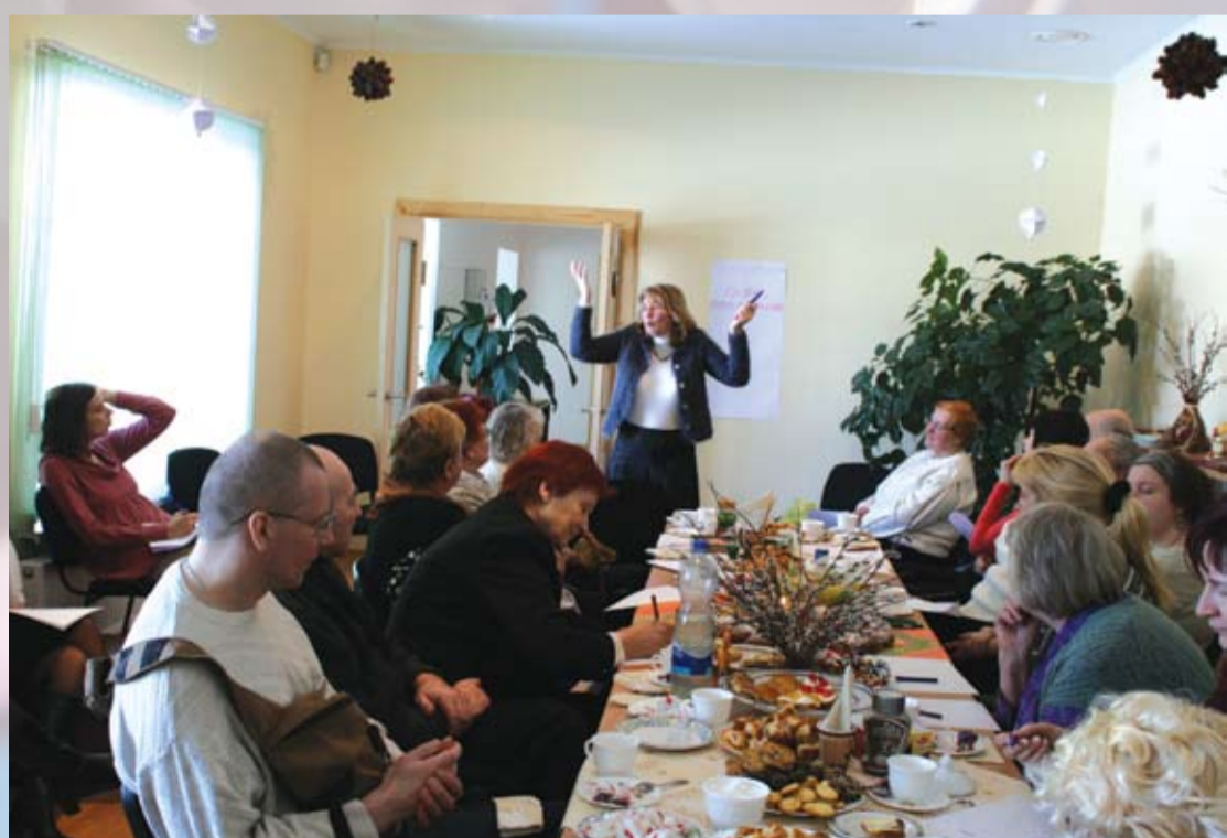
Es nezinu, kas par vainu, Ka man's puīši neprecē, Govis slaucu čirga čargs, Riju kuļu bika baks. (Sarunas par dzīvi un mīlestību Dienas centrā)