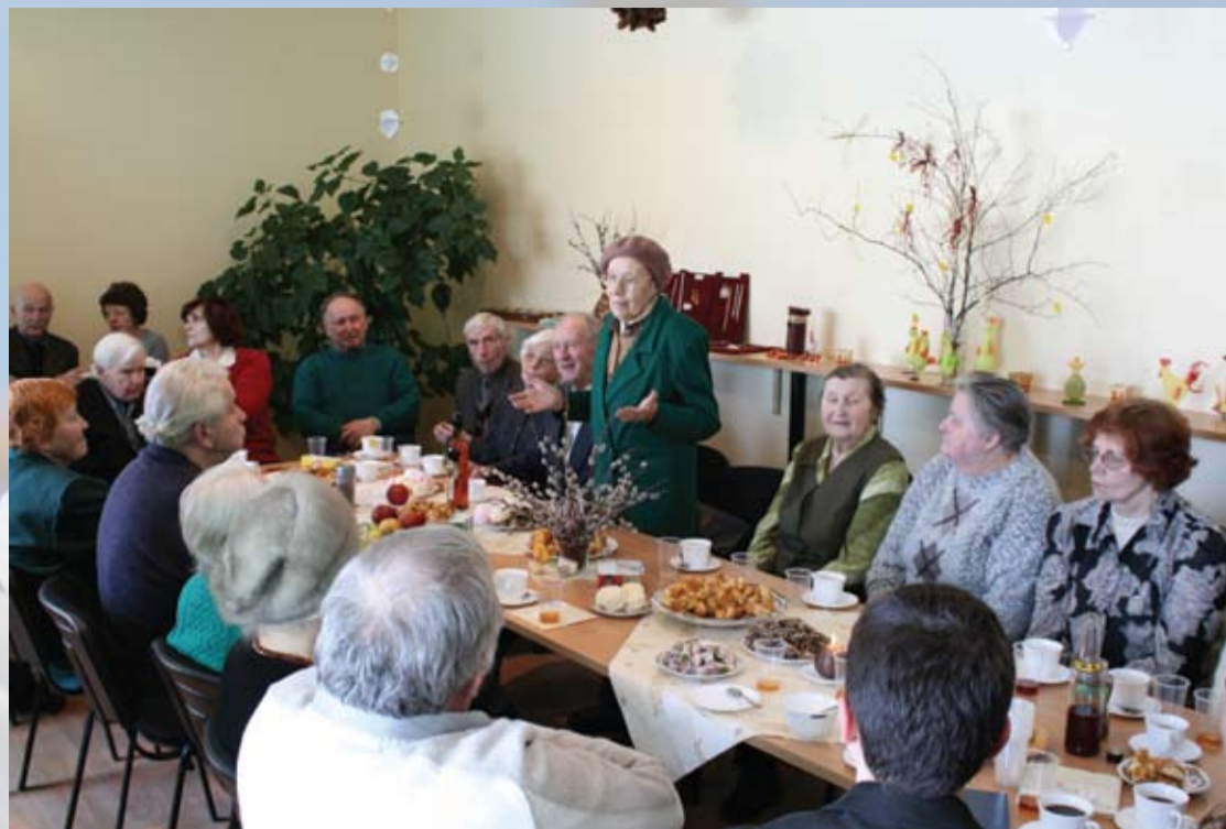
Dziedat, meitas, ar manim, Man ir gan greznu dziesmu; Svešas zemes izstaigāju, Pa vienai lasīdams. (Pieminot komunistiskā terora upurus)