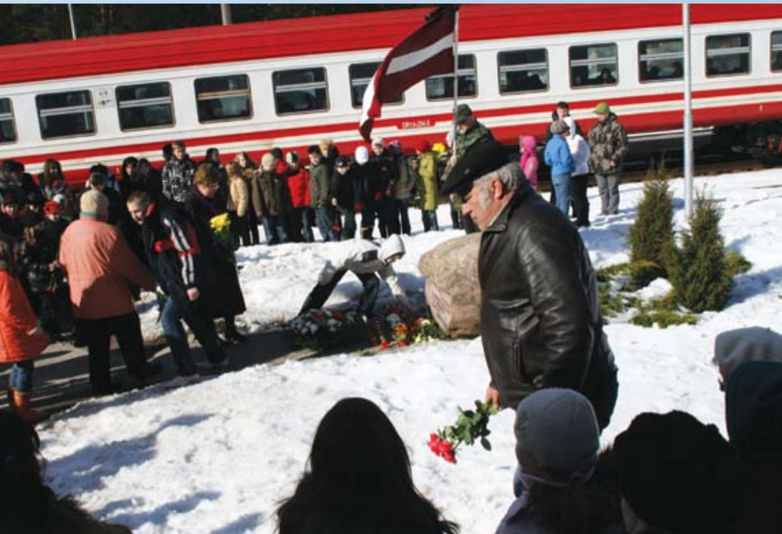
Salti vēji pūta, Bārgi kungi sūta, Tātajā zemitē, Pašā jūras līcītē. (Pieminot komunistiskā terora upurus)