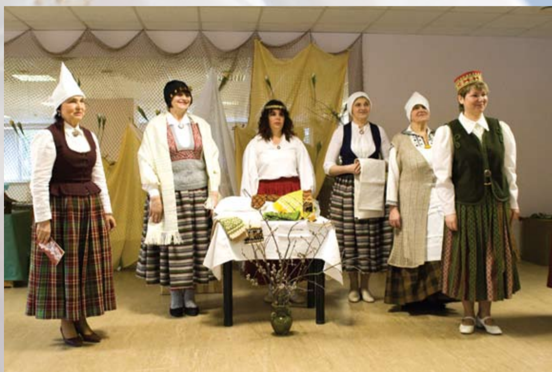
Tēvam bija sešas meitas, Visas sešas amatā: Divas grūda, divas mala, Divas smalkas šuveiņas. (Pīlādzītis sveic Garkalnes bibliotēku 60 gadu jubilejā)