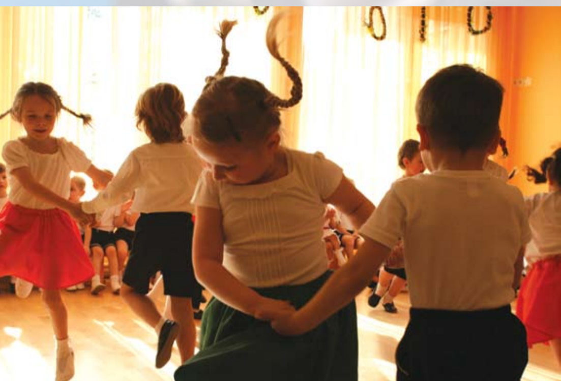
Jōņeišam brōļeņam Jeūseņš perka kumeļeņ; Mōreņai mōseņai Skūdre veja vainuceņ'. (Skudriņas mostas un dejo)