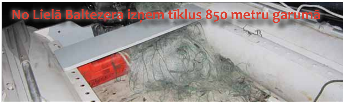
No Lielā Baltežera izņem tīklus 850 metru garumā

22.12.2011 vakarā Garkalnes novada pašvaldības policija sadarbībā ar Latvijas Makšķernieku asociācijas (LMA) Mobilās grupas inspektoriem reida laikā no Lielā Baltežera netālu no Auzu salas izņēma nelikumīgus zvejas tīklus kopā 850 metru garumā. Tikli 700 metru garumā bija savstarpēji sasieti un ezerā ievietoti krustveidā, tādējādi pilnībā aizšķērsojot zivju migrācijas ceļus, kuri ir vienlīdz labi zināmi gan likumpārkāpējiem, gan inspektoriem. Citur atrasti un izņemti divi tīkli – katrs 75 metru garumā. Kopumā tīklos bija vien dažas zivis – septiņi zandarti, deviņas līdakas, četri brekši un rauda. Tas liecina, ka tīkli ezerā ielikti pavisam nesen. Tīklos iekļuvušās zivis atbrīvotas.