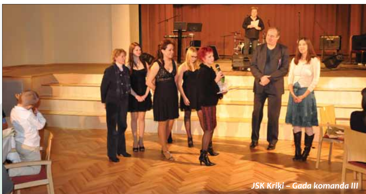
JSK Kriķi – Gada komanda III