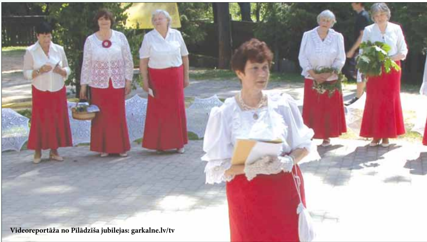
Videoreportāža no Pilādžiša jubilejas: garkalne.lv/tv