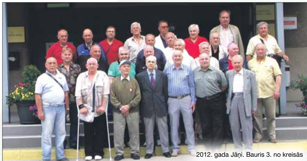
2012. gada Jāni. Bauris 3. no kreisās