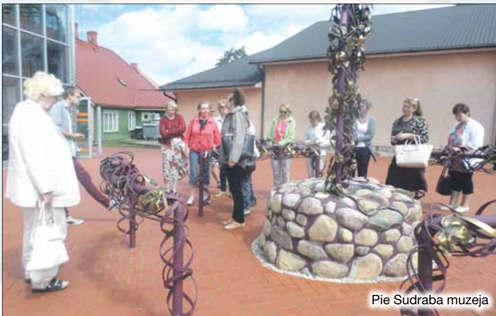
Pie Sudraba muzeja