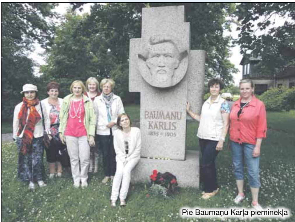
Pie Baumaņu Kārļa pieminekļa

Šā gada 9. jūlijā Garkalnes dāmu klubs „Pīlādžītis” devās savā ikgadējā braucienā pa Latviju, lai apskatītu Vidzemes rietumdaļu, bijušās lībiešu apdzīvotās teritorijas un tās vietas, kuras kādreiz ir jutušas arī rakstnieka Jāņa Jaunsudrabiņa pēdu pieskārienus.