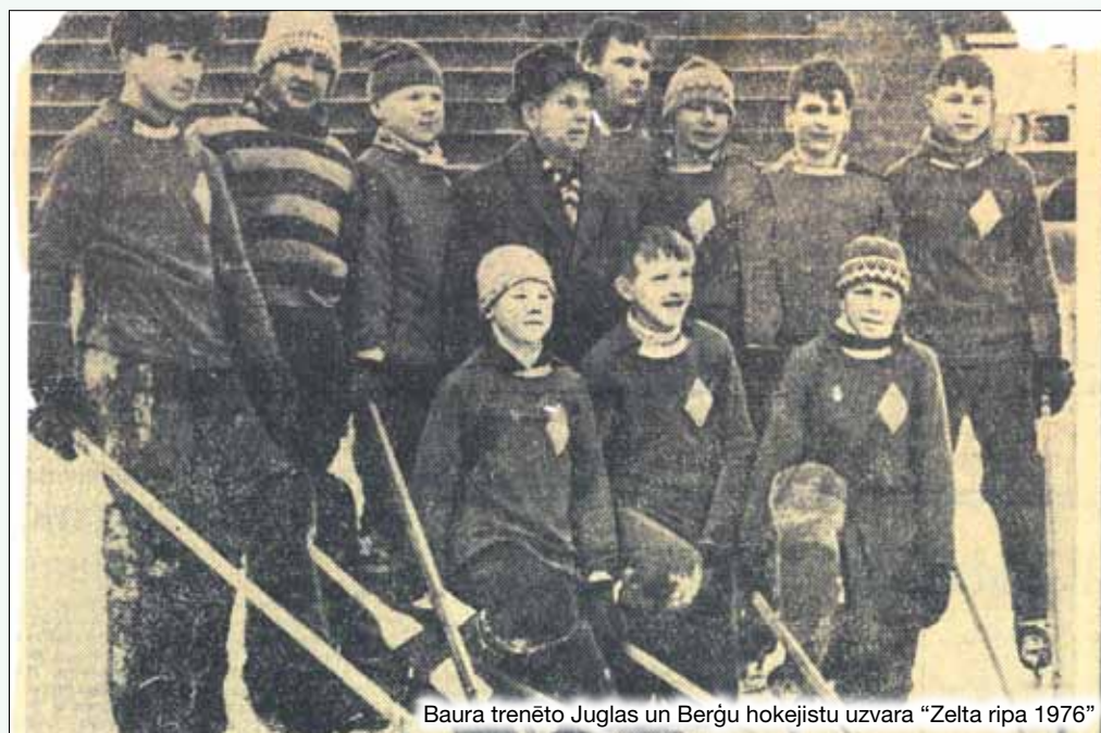
Baura trenēto Juglas un Berģu hokejistu uzvara "Zelta ripa 1976"