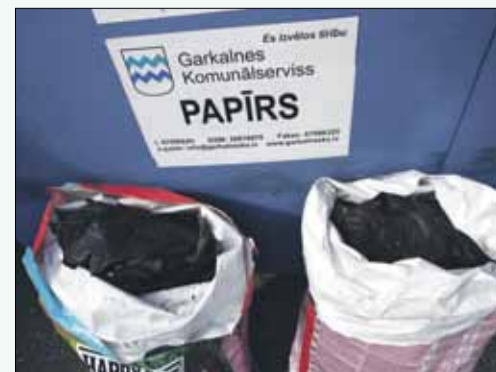
Bukultos papīra konteinerā atrasta akurāti iepakota jumta pape