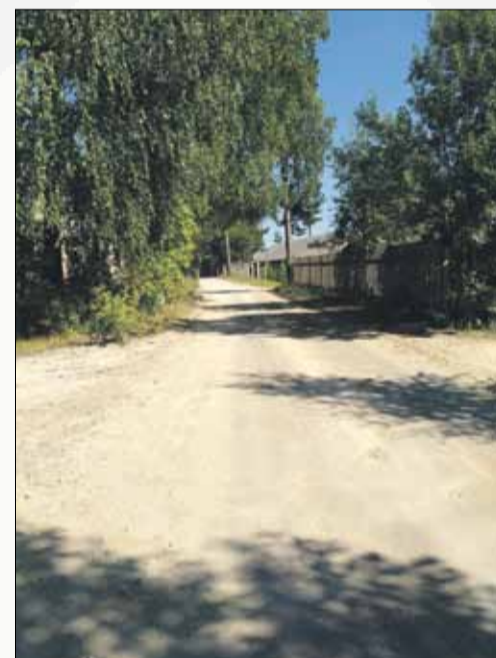
Lielās Zaļās ielas posms dažas dienas pēc greiderēšanas