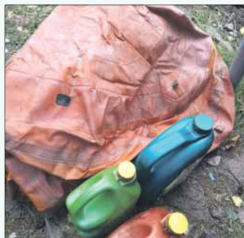
Blakus šķirošanas konteineriem novietota gumijas laiva un pilnas eļļas kannas