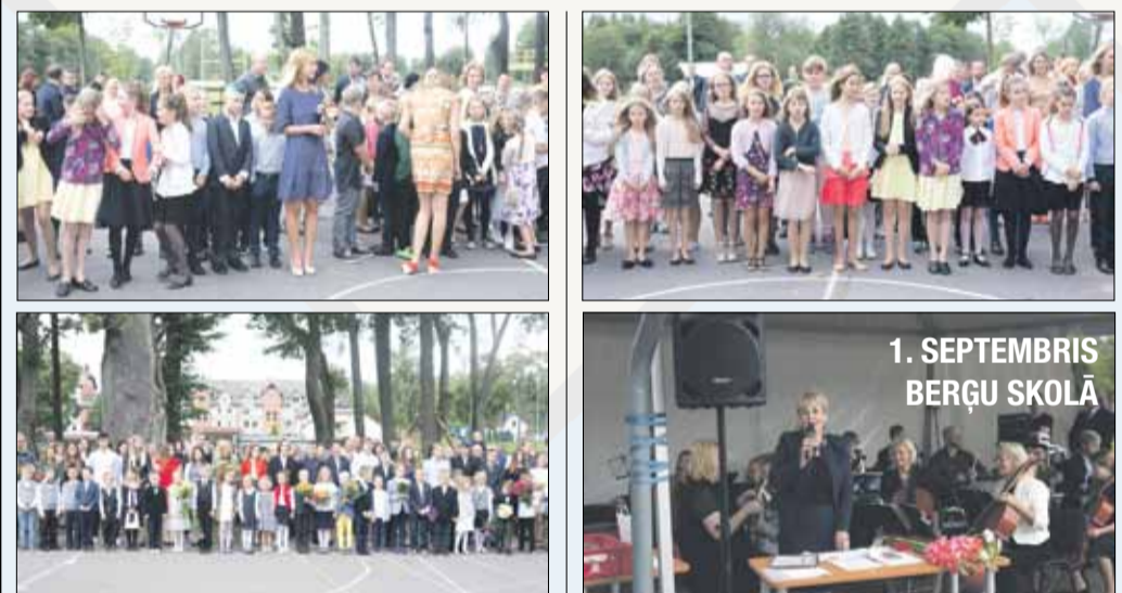
1. SEPTEMBRIS BERĢU SKOLĀ