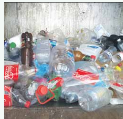
Kvalitatīvi sašķiroti plastmasas atkritumu Langstiņu šķirošanas punktā