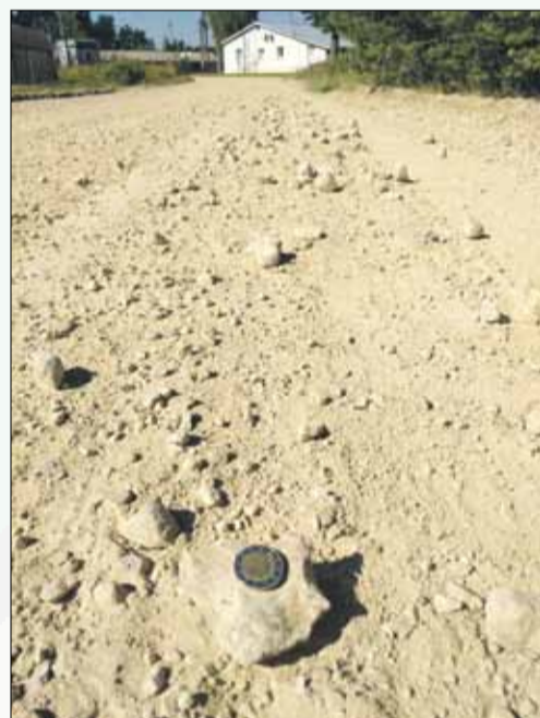
Lielā Zaļā iela Garkalnē uzreiz pēc greiderēšanas