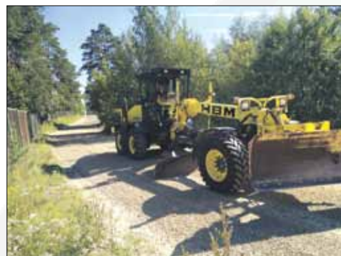
Šķembu klātnes smalkās frakcijas seguma atjaunošana