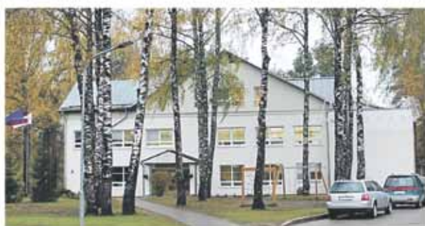
Berģu Mūzikas un mākslas pamatskola

CV sūtīt uz e-pastu berguskola@inbox.lv Tālrunis 29338507, 20265566