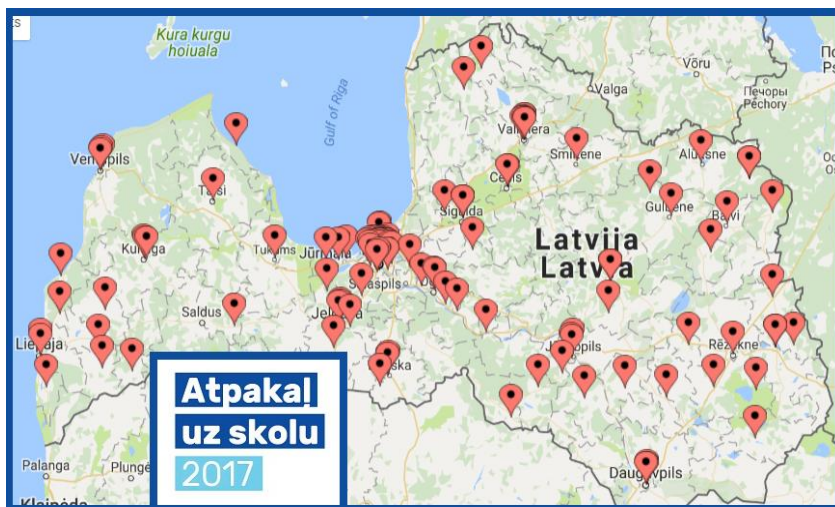
2017. gadā akcijas „Atpakaļ uz skolu” ietvaros apciemoto skolu karte

2017. gadā eksperti akcijas ietvaros viesojās 120 dažādās izglītības iestādēs Rīgā, Valmierā, Liepājā, Daugavpilī, Ventspilī, Jelgavā un vēl 60 citās apdzīvotās vietās visā Latvijā, tiekoties ar vairāk nekā 6000 skolēniem un studentiem. Izglītības iestāžu pārstāvji akcijas izvērtējuma anketās atzinīgi novērtēja sniegto iespēju tikt ar ekspertiem, jo tas jauniešiem palīdz ne tikai uzzināt par Eiropas Savienības aktualitātēm