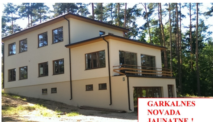
GARKALNES NOVADA JAUNATNE !